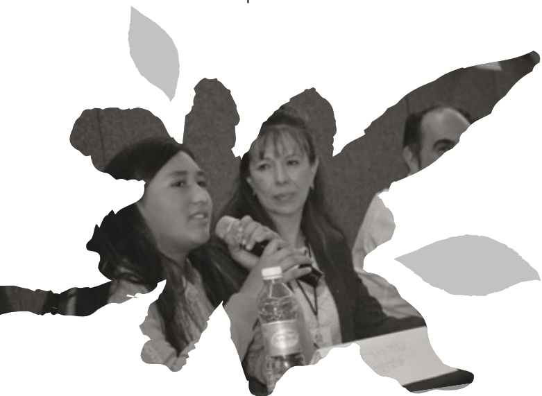
•El caso de Juan 3

El asunto de ver a niñas, niños y adolescentes como personas defensoras de los Derechos Humanos, es un tema que se analiza desde diversas aristas, algunas personas cuestionan si el nivel de desarrollo de la niñez o la adolescencia es el adecuado para la expresión o la defensa de sus derechos, sobre todo por el asunto de riesgo en que podrían colocarse; sin embargo, esta postura no tiene validez cuando desde los discursos se llevan a la práctica y cuando niñas, niños y adolescentes se asumen como defensoras y defensores de los Derechos Humanos, cuando generan procesos de análisis, de crítica y cuando proponen formas de realizar cambios y su voz tiene eco en otros espacios como el Congreso o los organismos internacionales, para esto se presentan ahora tres casos de niñas, niños y adolescentes que SEIINAC ha acompañado en la defensa y promoción de sus derechos.